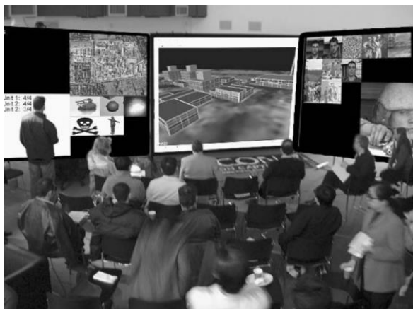
شکل ۲ مرکز فرماندهی کنترل مجازی پیاده سازی شده در دانشگاه برنول انگلستان [۱۴]

نظامی را توسعه داده و معرفی کردند که در آن فرماندهان می‌توانستند با یکدیگر و همچنین با میدان نبرد مجازی تعامل