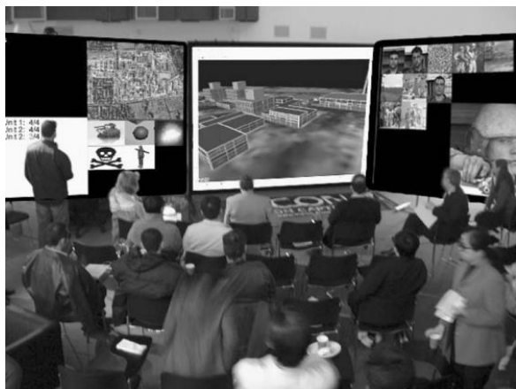
شکل ۲ مرکز فرماندهی کنترل مجازی پیاده سازی شده در دانشگاه برنول انگلستان [۱۴]

نظامی را توسعه داده و معرفی کردند که در آن فرماندهان می‌توانستند با یکدیگر و همچنین با میدان نبرد مجازی تعامل